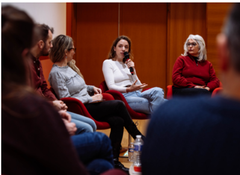
TABLE RONDE EN PRÉSENCE DES CINÉASTES DE LA COMPÉTITION