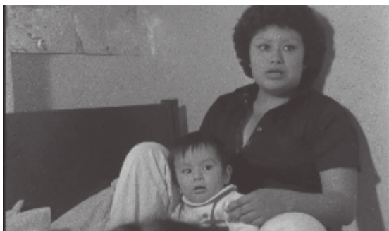
© Maru Tamés &amp; Maricarmen De Lara